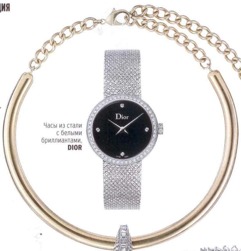
Часы из стали с белыми бриллиантами, DIOR