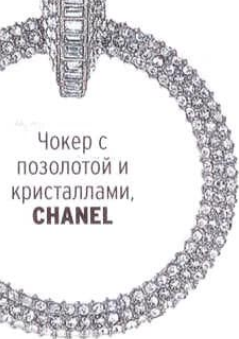
Чокер с позолотой и кристаллами, CHANEL