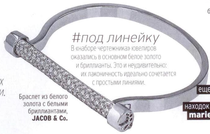
Браслет из белого золота с белыми бриллиантами, JACOB & Co.

Ювелирные украшения геометрических форм не загоняют нас в строгие рамки. Они, наоборот, готовы подчеркнуть почти любой образ.