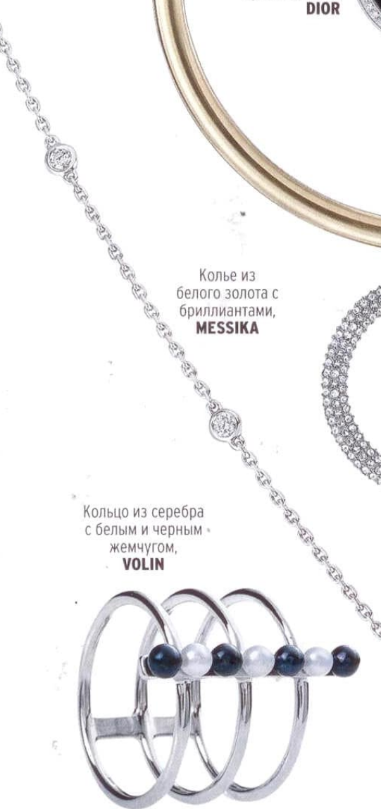
Колье из белого золота с бриллиантами, MESSIKA