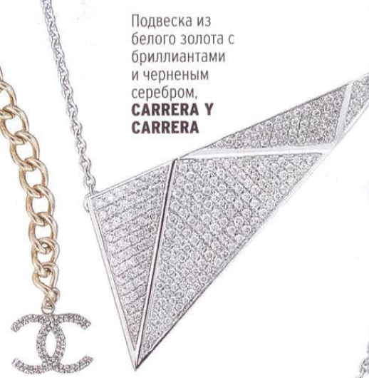
Подвеска из белого золота с бриллиантами и черным серебром, CARRERA Y CARRERA