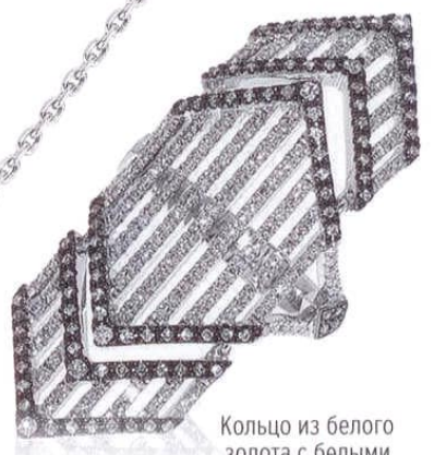
Кольцо из белого золота с белыми и черными бриллиантами, CASATO