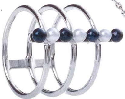
Кольцо из серебра с белым и черным жемчугом, VOLIN